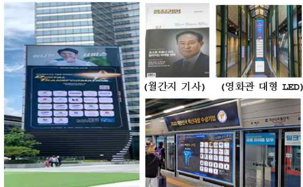
(삼성동 대형 LED 광고)