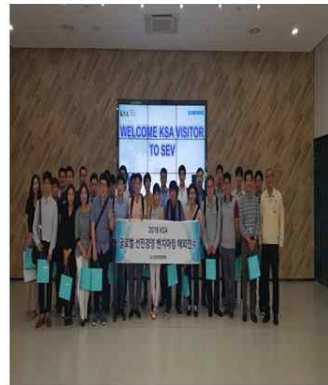
(18년 베트남 삼성전자 사업장 방문)