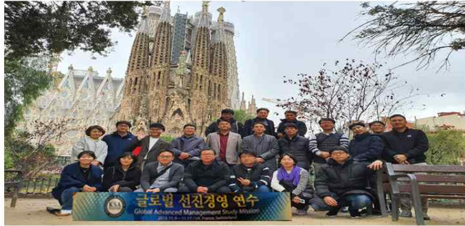
(19년 스페인 바르셀로나 성가족 성당 방문)