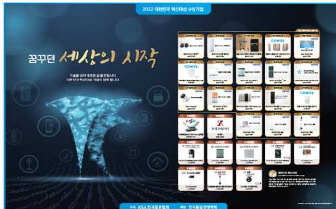
(2022 조선일보/ 한국경제 / 품질경영 월간지 연합광고)