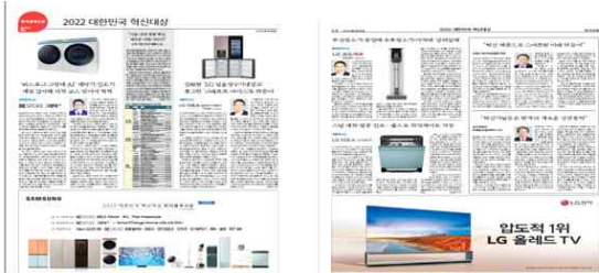
(한국경제 기업 특집기사 / 행사 사진 기사)