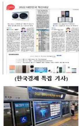
(지하철 스크린 PSD광고)