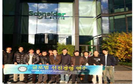
(13년 프랑스 Schneider Electric 방문)