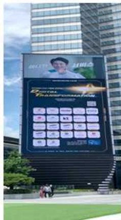
(삼성동 LED 옥외광고)