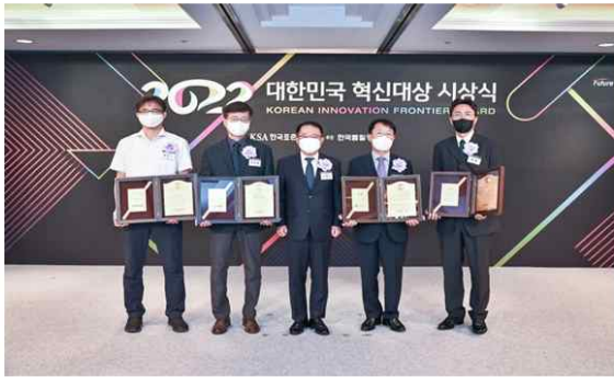
(혁신대상 수상자 단체사진)

▷ 일 시 : 2023. 6월(미정) ▷ 장 소 : 롯데호텔 서울(소공동)(미정)